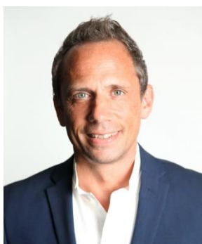
Staatsminister Thorsten Glauber (MdL) eröffnet die 6. Energiemesse element-e 2019 am Samstag, den 06.04.2019