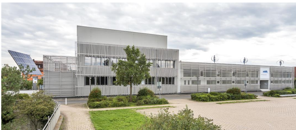
Der Energiepark Hirschaid als zertifiziertes EU-Green-Building als idealer Veranstaltungsort der Energiemesse

Im Außenbereich direkt gegenüber dem Gebäude befindet sich die Aktionsfläche „NEUE MOBILITÄT“ mit einer Vielzahl an E-Fahrzeugen , die unseren Besuchern für kostenfreie Probefahrten zur Verfügung stehen. Auf dem Freigelände im Innenhof befindet sich neben zahlreichen Aussteller aus der Welt der Erneuerbaren Energien und der E-Mobilität der M+E-Infotruck – eine Informationsstelle zum Thema Ausbildungsberufe und moderne Berufsbilder in der Metall- und Elektroindustrie für Schülerinnen und Schüler aller Schularten. Zum Geländeplan: hier .